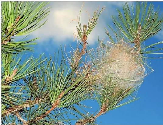
Un nido de procesionaria en el alto de un pino.