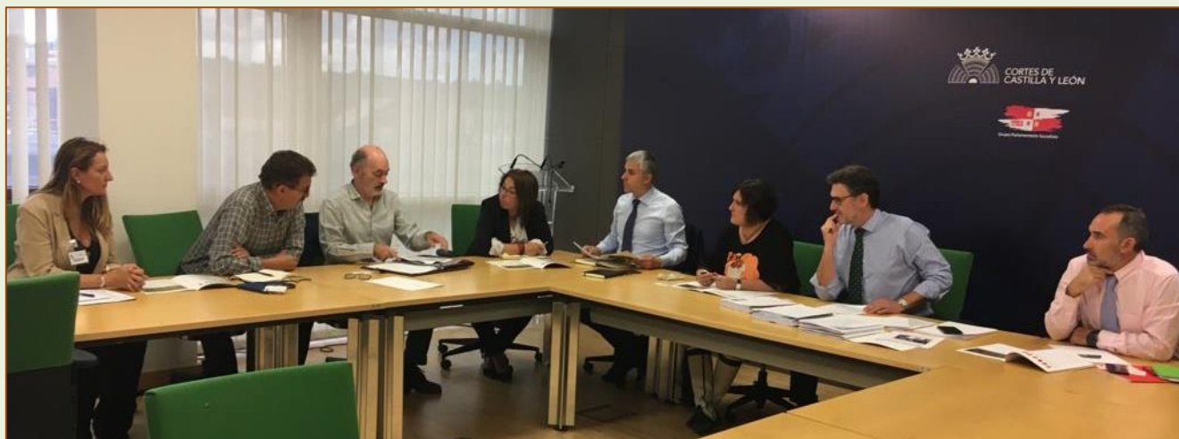
Momento de la reunión entre Fafcyle y PSOE en las Cortes

Fafcyle mantuvo el pasado 24 de septiembre un encuentro con representantes del grupo parlamentario socialista en las Cortes de Castilla y León. El objetivo era trasladarles las necesidades de la Federación y del sector forestal privado de Castilla y León.